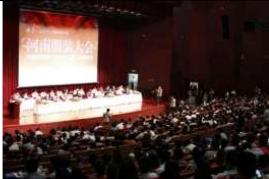
图表 12 河南服装大会赞助