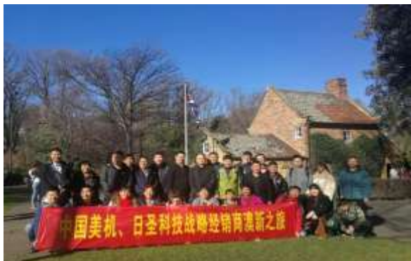
销售高管与经销商澳洲新西兰 12 天

公司还十分重视员工的业余文化生活，经常性的开展丰富多彩的文化娱乐活动，如旅游活动、技能比武等，在员工娱乐的同时，充分展示员工才艺、增进了解和交流。