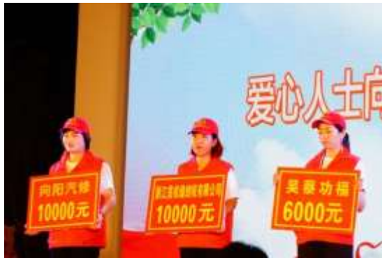
图表 17 慈善总会捐款