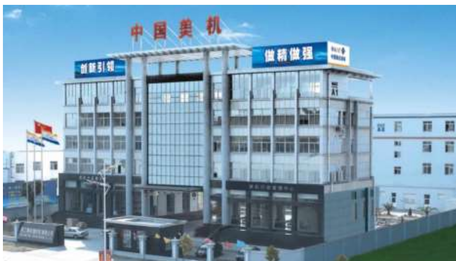
图表1 浙江美机缝纫机有限公司厂区概况

浙江美机缝纫机有限公司座落于“中国缝制之都”的台州温岭市，是中国领先的缝制机械机电一体化整体解决方案优秀提供商。公司主营平缝、包缝、绷缝、曲折缝、特种机、自动缝制单元等六大系列200多种品种，倡导“机电一体化”，为制衣、制帽、制包、制鞋等行业提供技术设备及解决方案服务。公司年生产能力达到50万台工业缝纫机，拥有世界上先进的检测设备和各种加工设备。自1995年成立以来，美机从一家作坊式小厂逐步发展成为中国乃至世界重要的缝制机械研发和生产基地、缝制机械“电脑车专家、机电一体化领先品牌”，成功跻身缝纫机行业前列。