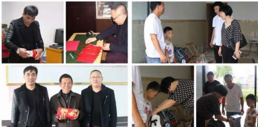
图表 19 敬老院慰问

公司高层领导重视社会责任，以身作则，关注困难员工，带头捐款捐物；关注社会，积极捐助贫困学生，以实际行动回报国家和社会。