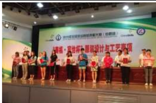
图表 13 赞助行业技能大赛