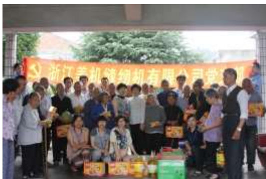
图表 14 党支部慰问