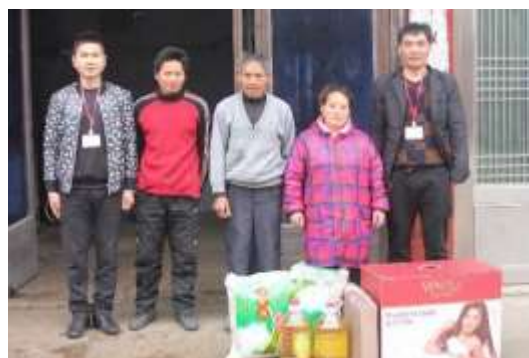
图表 22 困难群众慰问