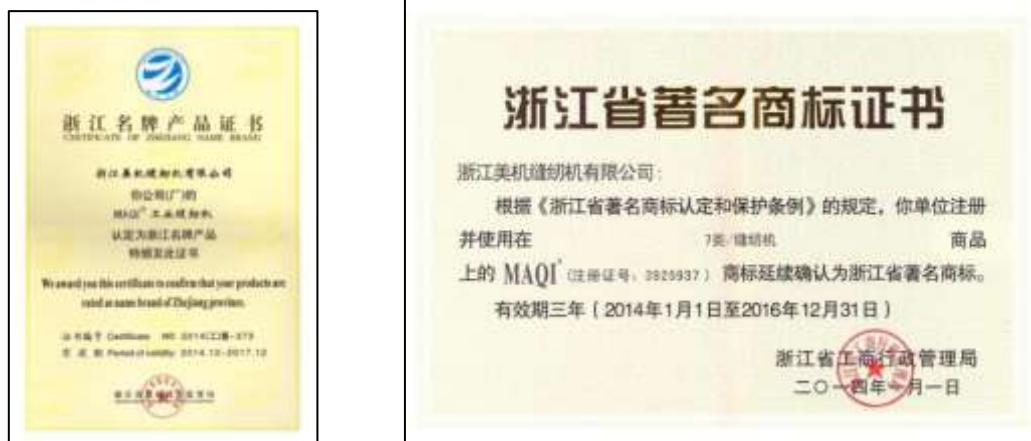
图表 25 公司获得的主要省级以上荣誉证书