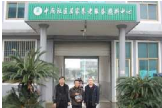
图表 18 养老院慰问