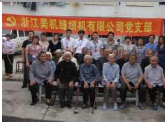
图表 21 美机党支部关爱孤寡老人