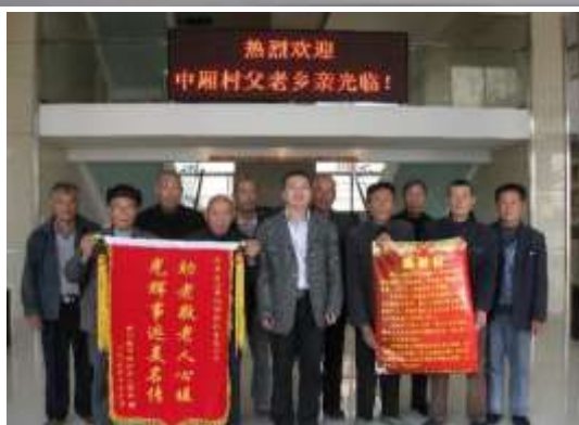
图表 20 董事长回馈中厢村父老