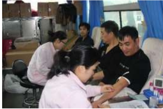
图表 16 美机员工义务献血