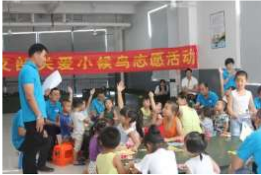
图表 15 关爱小候鸟