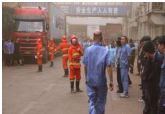
春季全员消防大演练